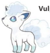
Vulpix de Alola

Algunos Pokémon se han adaptado al entorno de la Región de Alola tomando aspectos y características concretas.